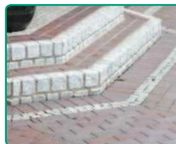
Typická aplikace na tvrdé dlažby.