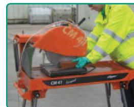
Super Stradalit Evo na CM41 (strana 96)