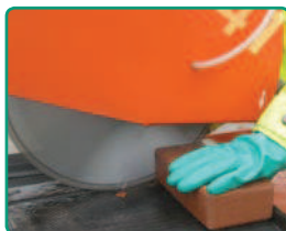
Profesionální řezání cihel.